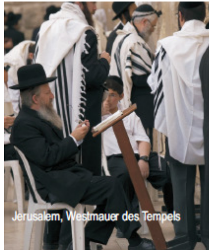
Jerusalem, Westmauer des Tempels

Der Nachmittag endet mit einer besinnlichen Stunde am Gartengrab.